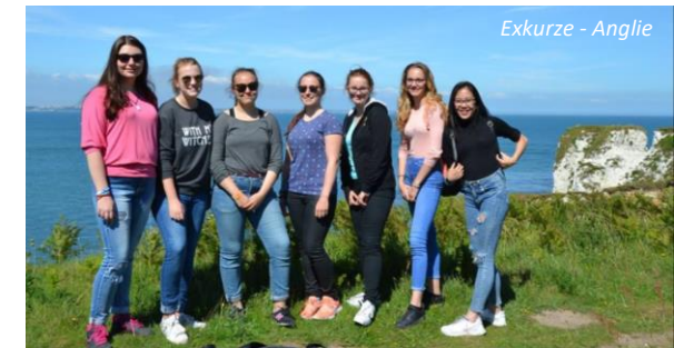
Exkurze - Anglie

V prvních dvou ročnících mají všichni žáci stejný učební plán.