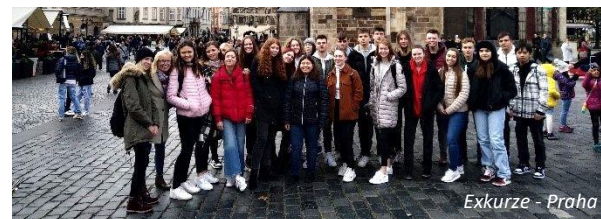
Exkurze - Praha